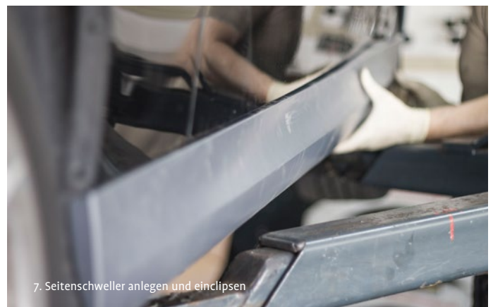
7. Seitenschweller anlegen und einclippen