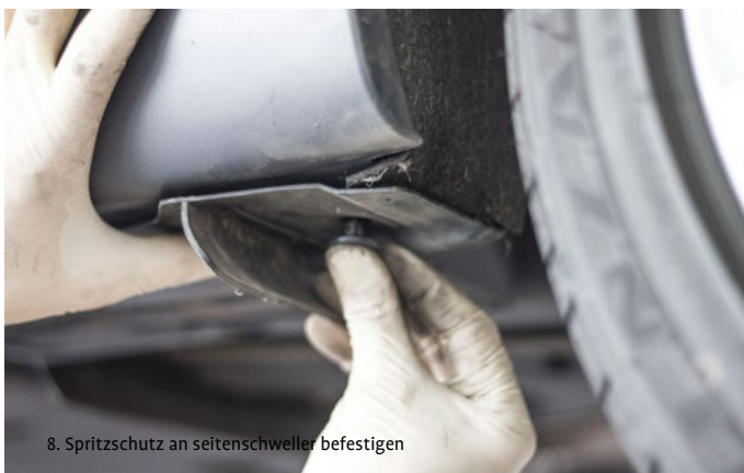
8. Spritzschutz an seitenschweller befestigen