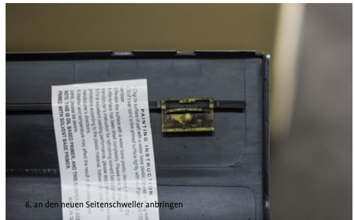
6. an den neuen Seitenschweller anbringen