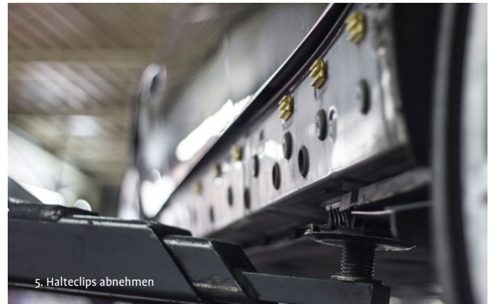
5. Halteclips abnehmen