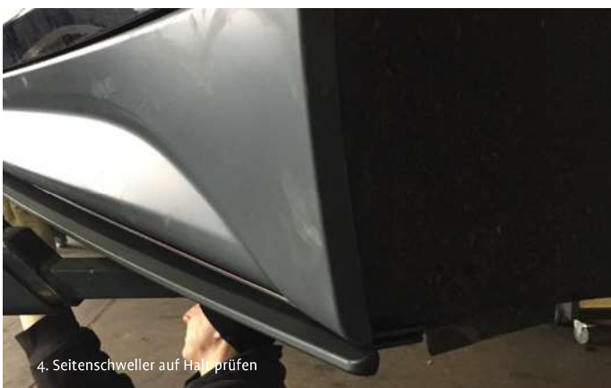
4. Seitenschweller auf Halt prüfen