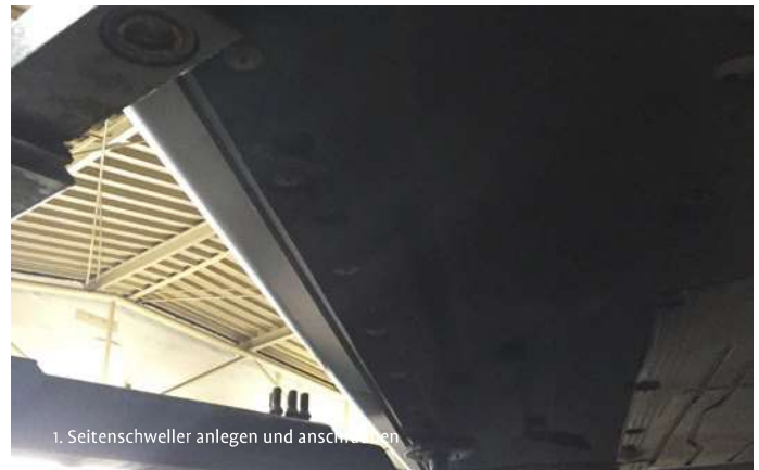
1. Seitenschweller anlegen und anschließen