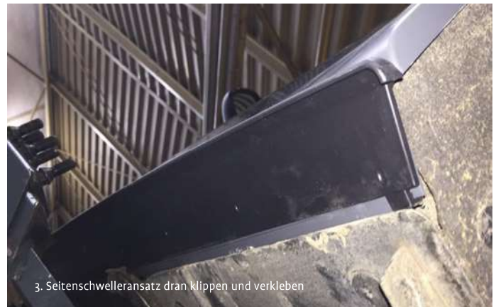
3. Seitenschwelleransatz dran klippen und verkleben