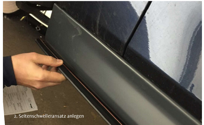
2. Seitenschwelleransatz anlegen