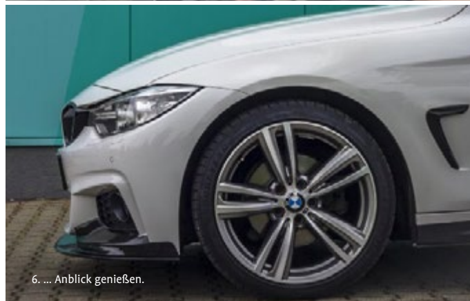
6. ... Anblick genießen.