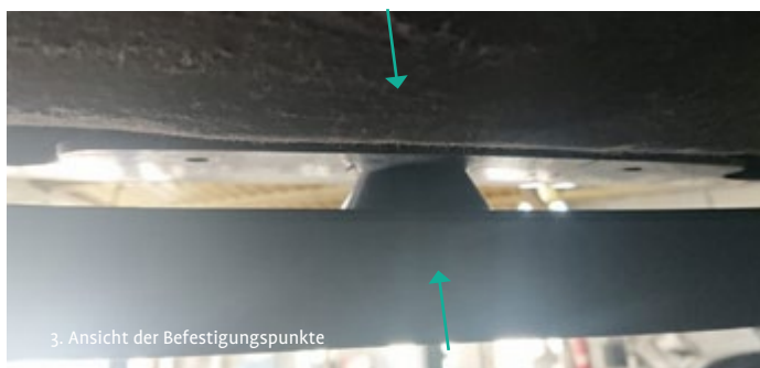
3. Ansicht der Befestigungspunkte