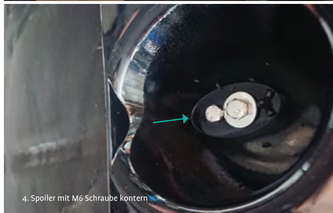
4. Spoiler mit M6 Schraube kotern