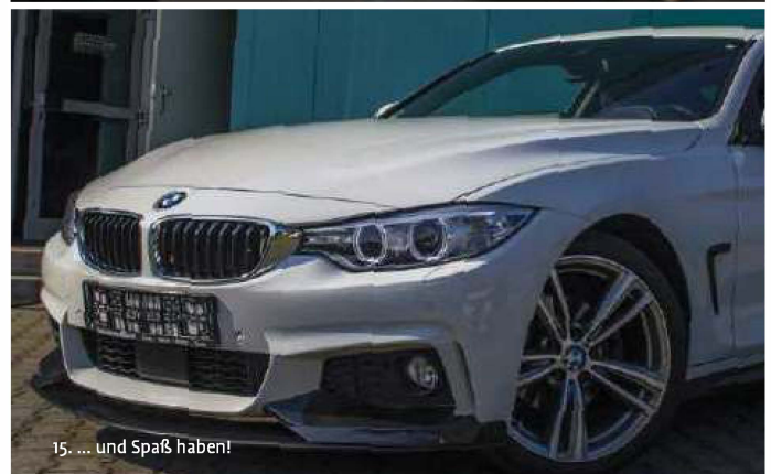
15. ... und Spaß haben!