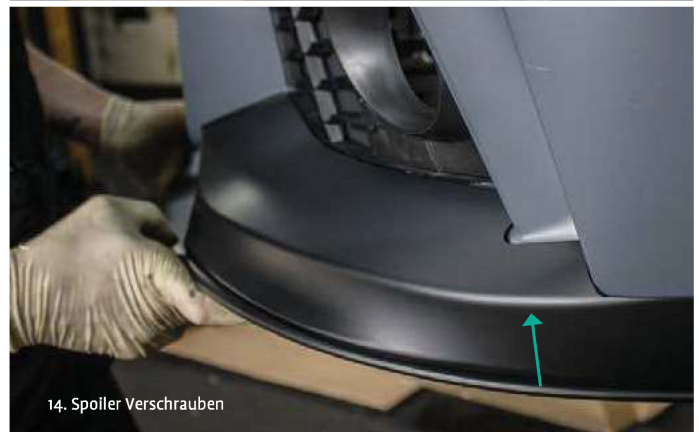
14. Spoiler Verschrauben