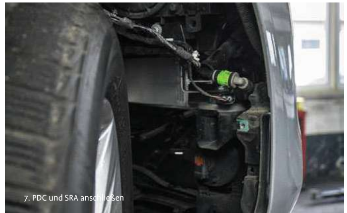
7. PDC und SRA anschließen