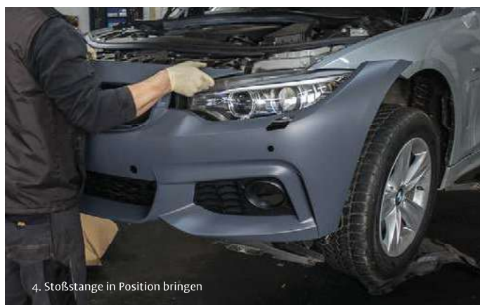
4. Stoßstange in Position bringen