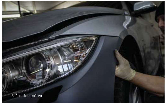
6. Position prüfen