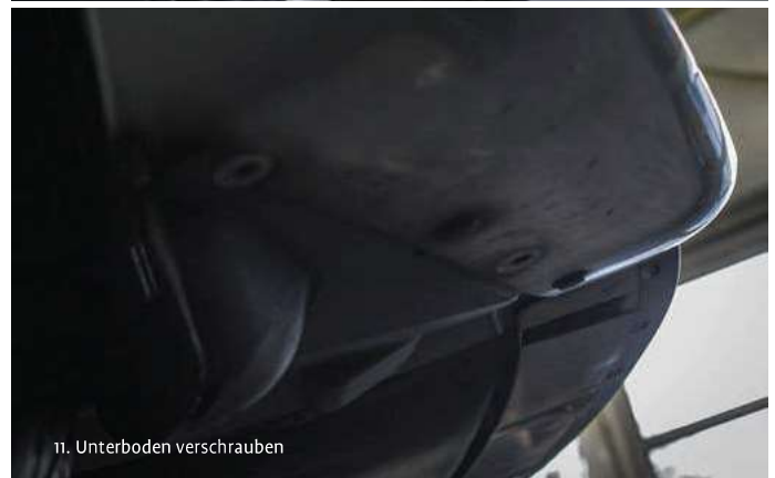
11. Unterboden verschrauben