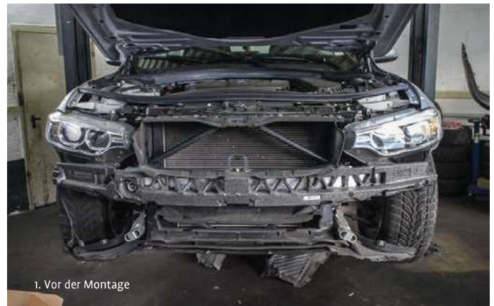
1. Vor der Montage