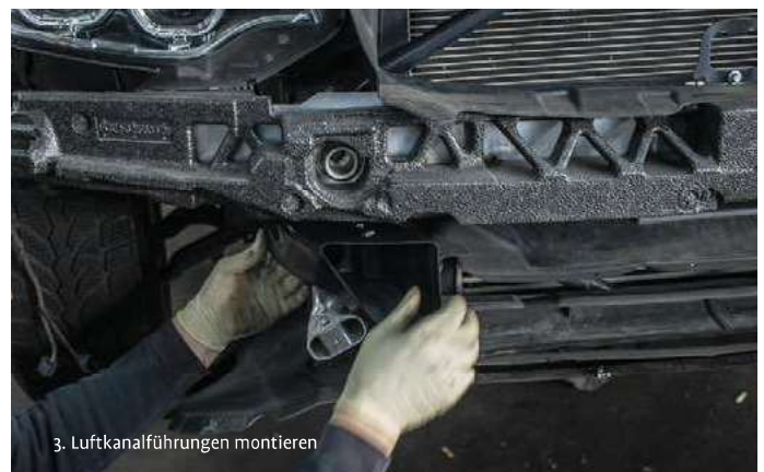
3. Luftkanalführungen montieren