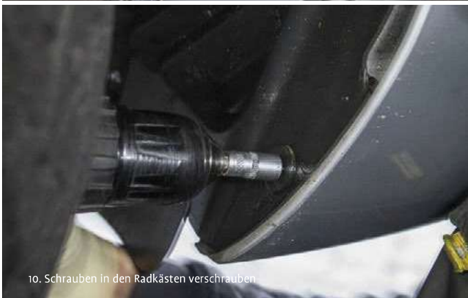
10. Schrauben in den Radkästen verschrauben