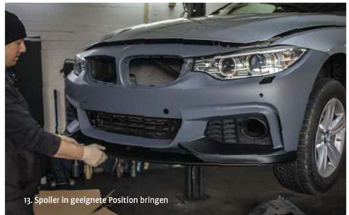
13. Spoiler in geeignete Position bringen