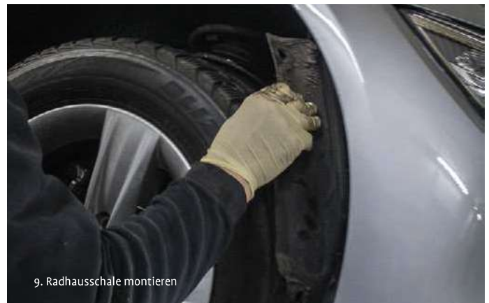
9. Radhausschale montieren