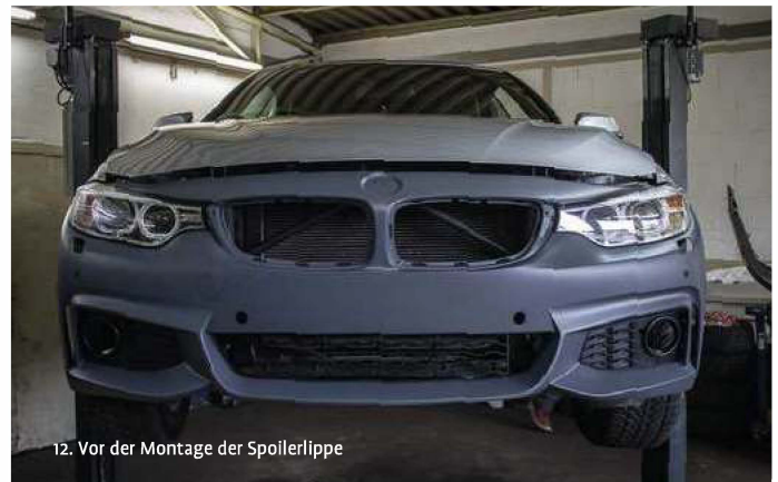
12. Vor der Montage der Spoilerlippe