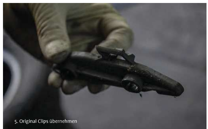
5. Original Clips übernehmen