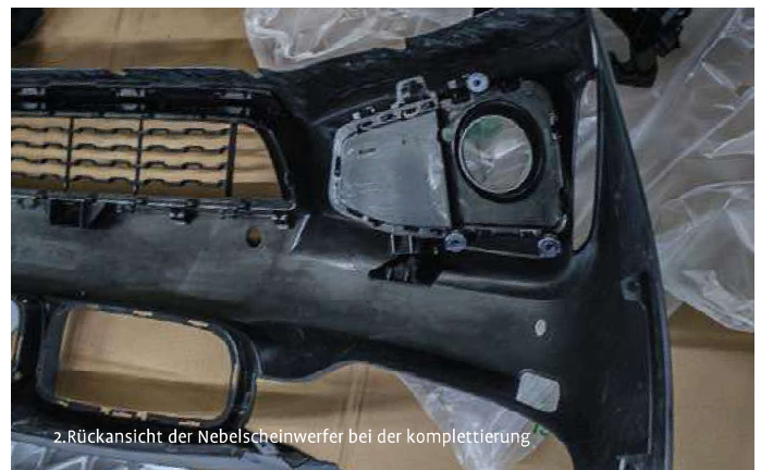
2. Rückansicht der Nebelscheinwerfer bei der Komplettierung